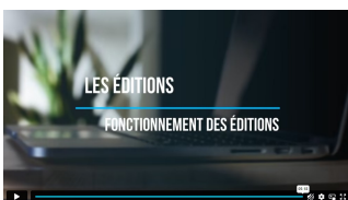
Vidéo sur le fonctionnement des éditions